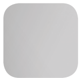
Laminado a quente