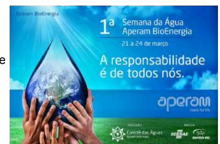
Poster da primeira Semana da Água - Aperam BioEnergia

3 GHG (Gás de Efeito Estufa)- aqui o Dióxido de Carbono (CO 2 )