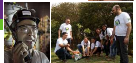
Colaboradores de Timoteo e Campinas